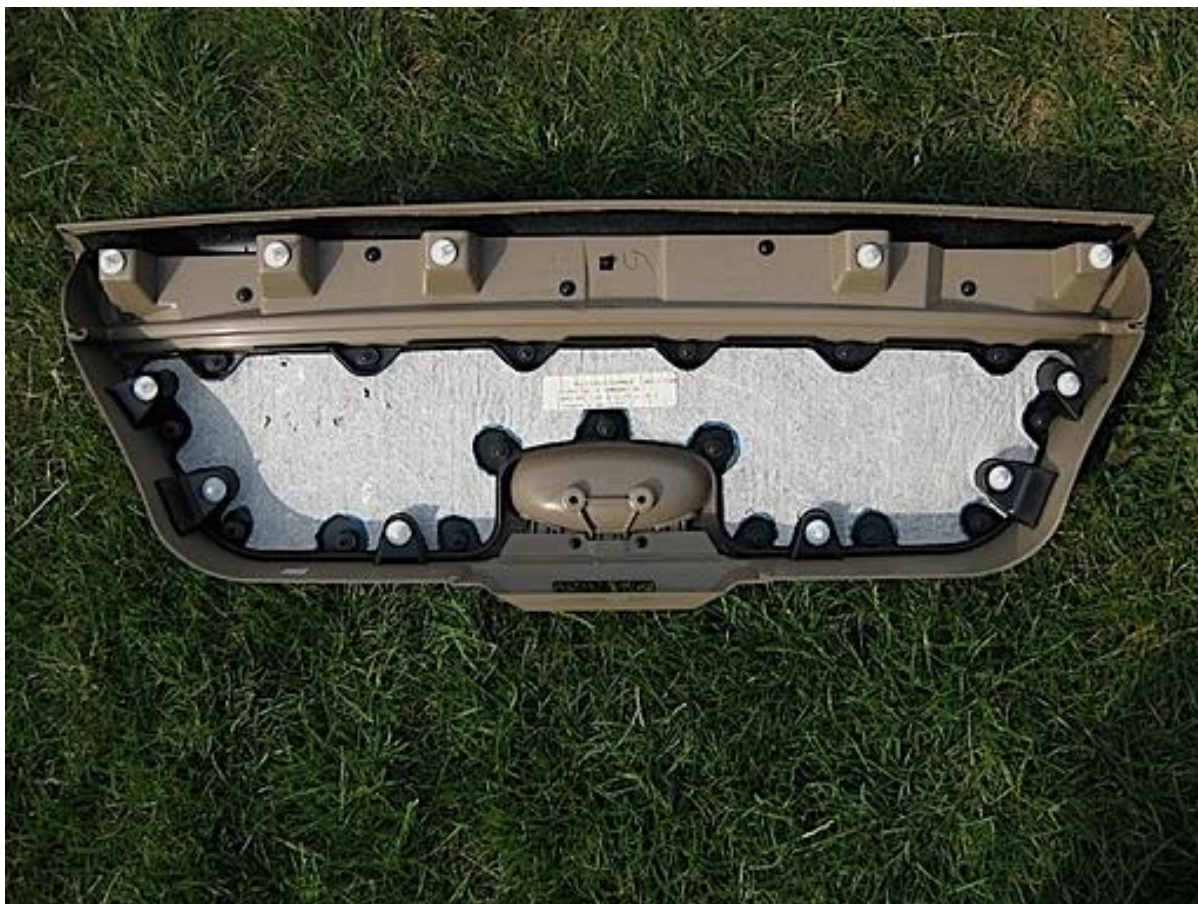
Figuur 4. Hier kun je locatie van de pluggen (witte dopjes) zien.

Vervolgens neem je een beitel of brede schroevendraaier en wikkelt hier crepetape of (heb ik gebruikt) isolatietape omheen, zodat je de lak niet beschadigd. Dan begin je aan een kant met het loswrikken van de plastic pluggen. Er zijn in totaal 11 pluggen (!), dus neem de tijd om ze rondom rustig los te maken.