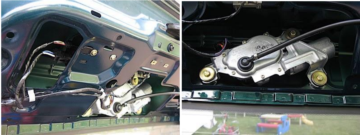
Figuur 5. Centrale vergrendelingsmotor en ruitenwissermotor.

Als je langs de ruitenwissermotor kijkt zie je twee gaten in het plaatstaal, waardoor je aan de twee schroeven van de kofferbakgreep kunt komen (op figuur 6 in het donker niet zichtbaar) . Draai die los met een 10mm dopsleutel met een verlengstuk ertussen. De greep kan er nu vanaf.