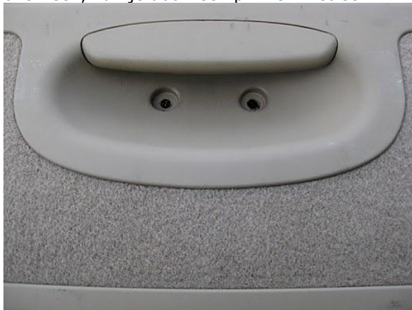
Figuur 3. Schroeven binnenbekleding.

Schroef de twee schroeven in de handgreep in de binnenbekleding los. Er zitten plastic kapjes overheen, kun je doorheen prikken met een #2 kruiskopschroevendraaier.