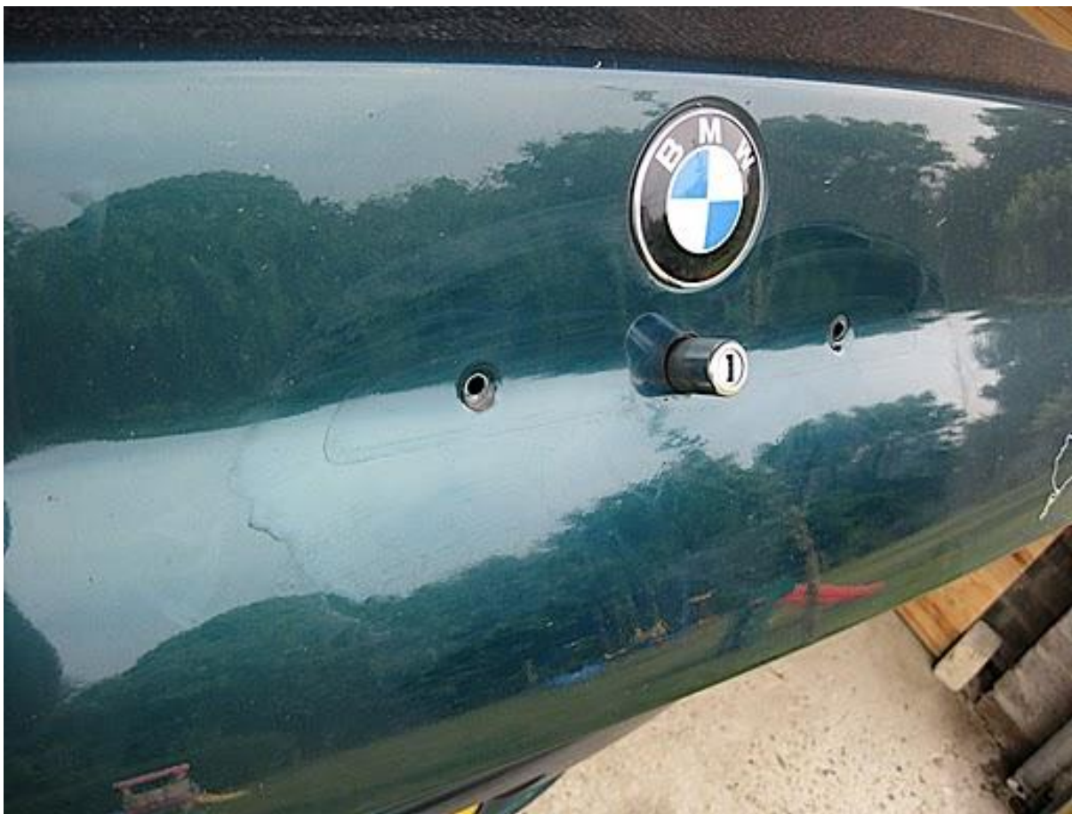
Figuur 6. Achterklep zonder greep.

Monteer je frische Heckklappeabdichtungsgummi op de greep en schroef de handel weer in elkaar. De binnenafdekking kun je weer terugduwen (even een tikje op de 11 plekken waar de pluggen zitten).