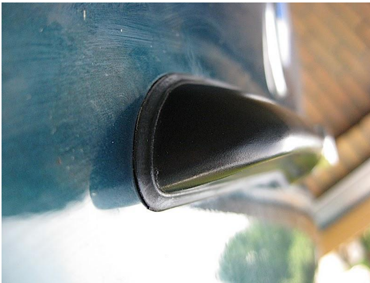
Figuur 7. Fantastisch eindresultaat!

Twee schroefjes weer in de binnengreep en klaar!