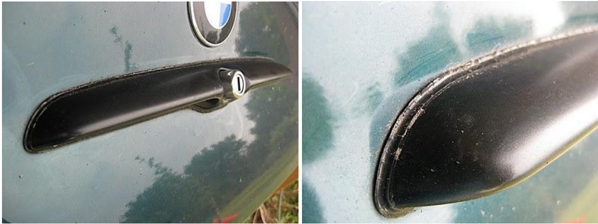
Figuur 1. Zo kan het rubber er na een aantal jaren uitzien.

De Z3 coupe heeft een handgreep op de achterklep, waarbij tussen achterklep en handgreep een rubber zit.